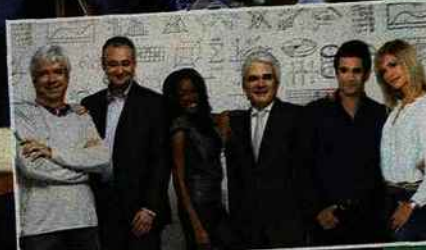
La nouvelle équipe de L'Inventeur 2012