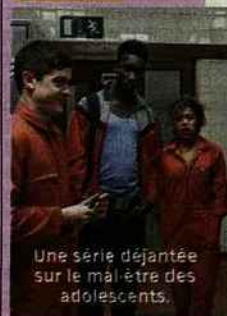
Une série déjantée sur le mal-être des adolescents.

adolescent. Une série rock'n'roll au potentiel énorme. G.T. EN BREF Un mix réussi de Skins et Heroes.